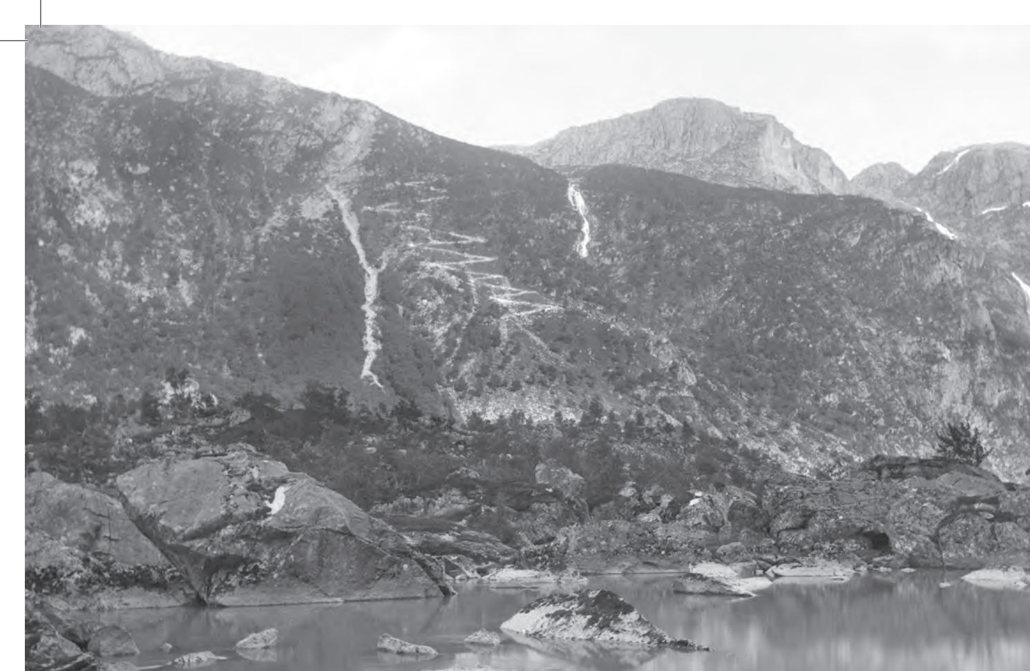
Den nye veggen. The new bridgeway.