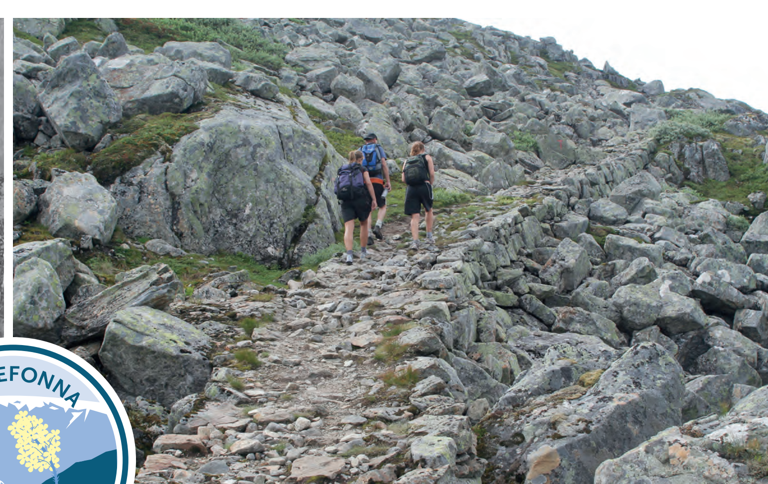
Ovanfor Gjeldfeskaret. Above Gjeldfeskaret Pass.