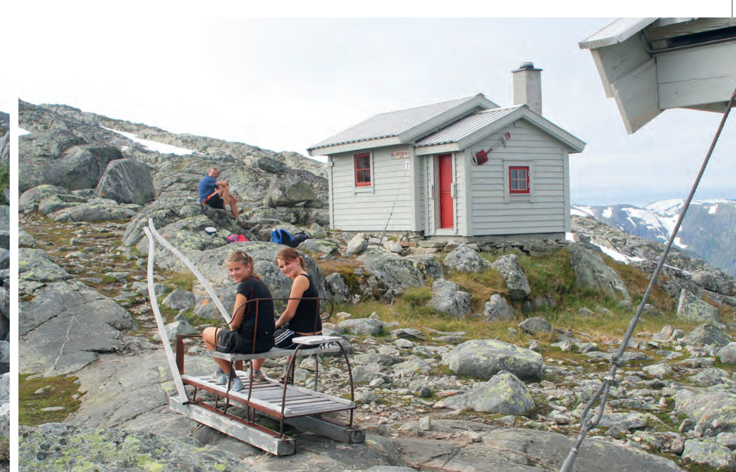
Breidablikk. The Breidablikk cabin.