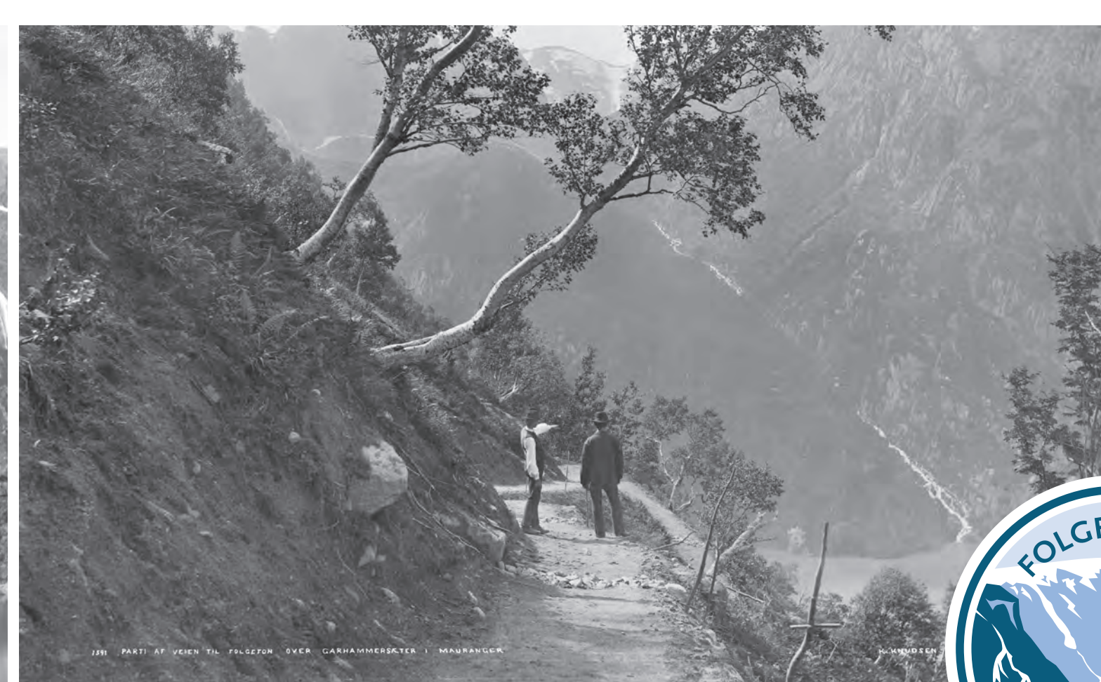
I Hidlarslia. At Hidlarslia.